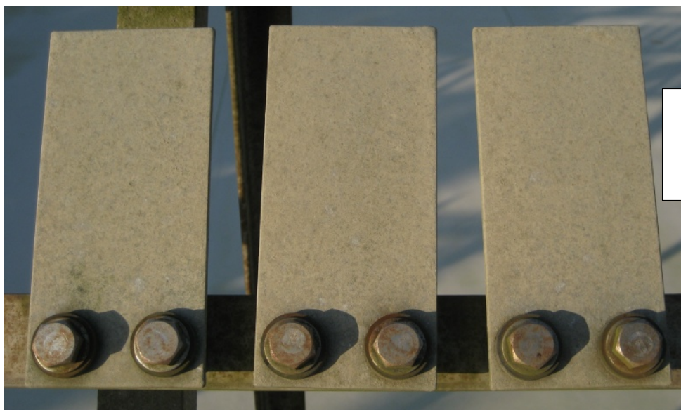
アルミめっき HDA2 (70 μm 以上)